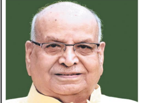
श्री लाल जी टंडन जी, राज्यपाल

दीक्षांत समारोह के पूर्व महामहिम राज्यपाल एवं कुलाधिपति सम्माननीय श्री लाल जी टंडन की अध्यक्षता में ग्रामोदय विश्वविद्यालय प्रबंध मंडल की बैठक संपन्न होगी। बैठक में मध्यप्रदेश शासन के अनेक विभागों के प्रमुख सचिव स्तर के अधिकारियों सहित गैर सरकारी सदस्य भी सम्मिलित होंगे।