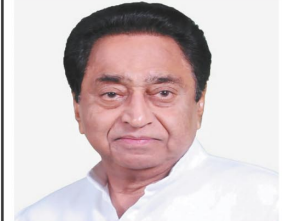
श्री कमल नाथ जी, मुख्यमंत्री